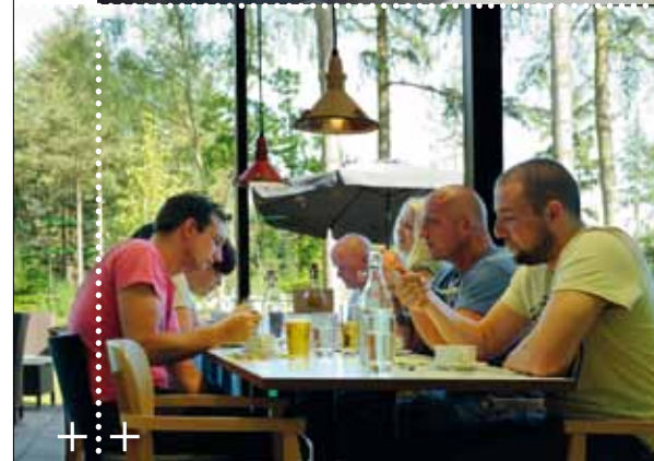
Eten en drinken