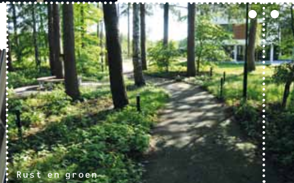
Rust en groen